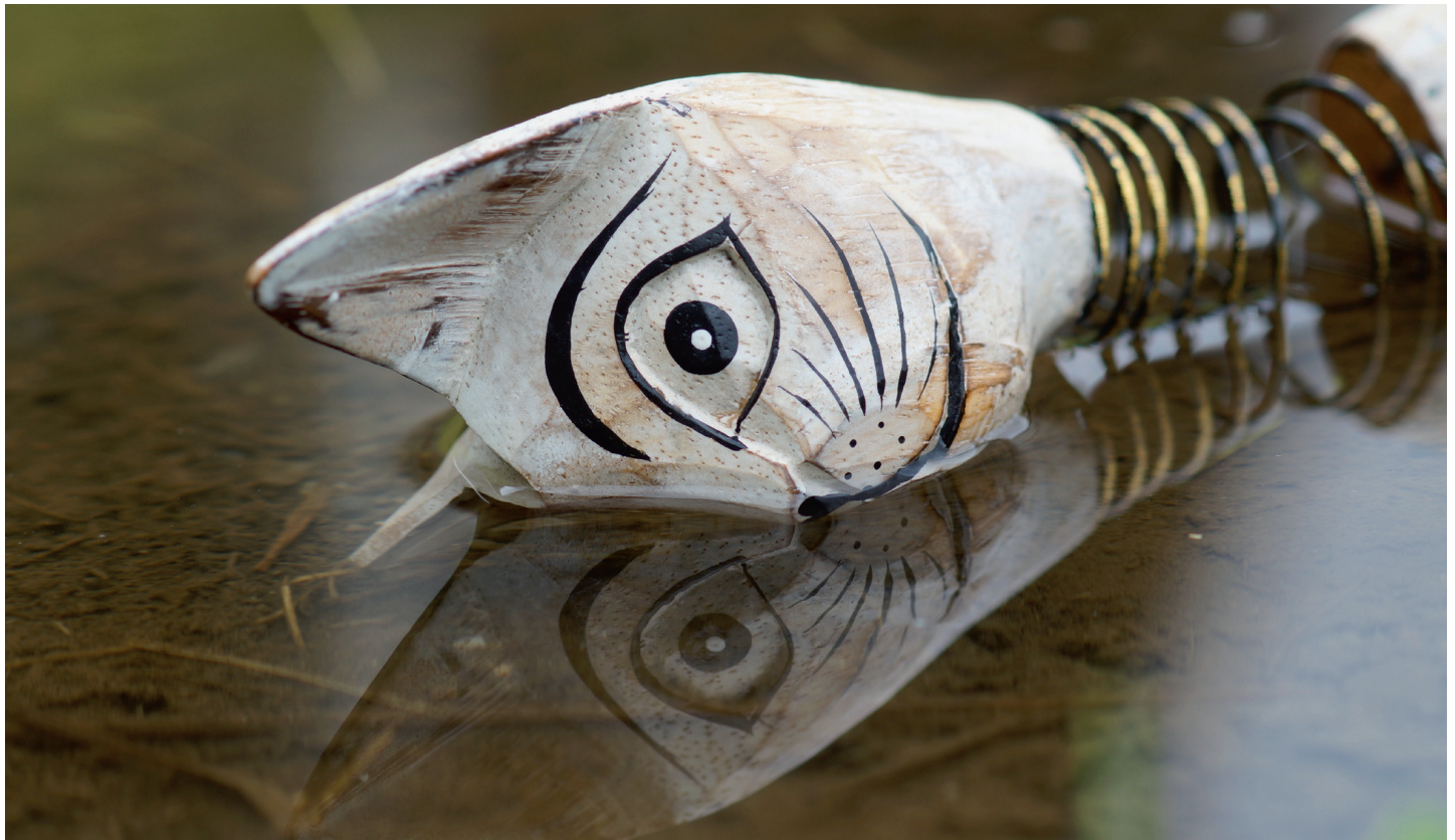
nach der didaktischen Aufgabenstellung «Mit Kopf, Auge und Herz», Klosters 2016