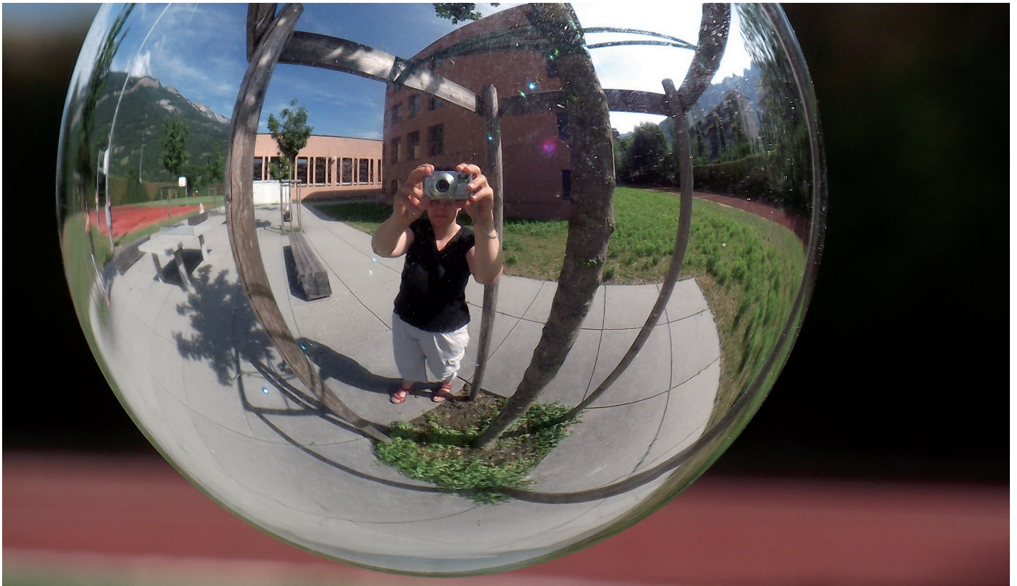
Foto: Maja Bieger, nach der didaktischen Aufgabenstellung «Fotografieren mit einer Christbaumkugel», Chur 2010